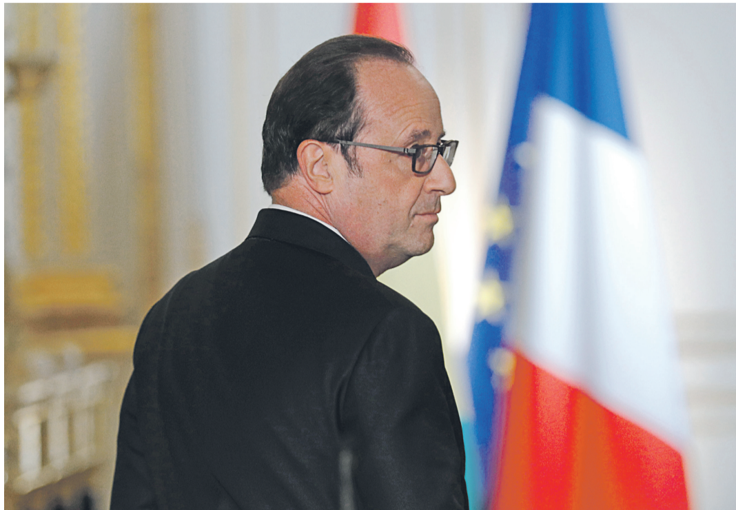
Dosluhujúci Francois Hollande za svoje pôsobenie na čele krajiny zožal väčšinou len kritiku.

Náročné to majú v krajine aj zamestnávateľia, ktorých príjmy podliehajú komplikovanému systému progresívneho zdaňovania, ktorý